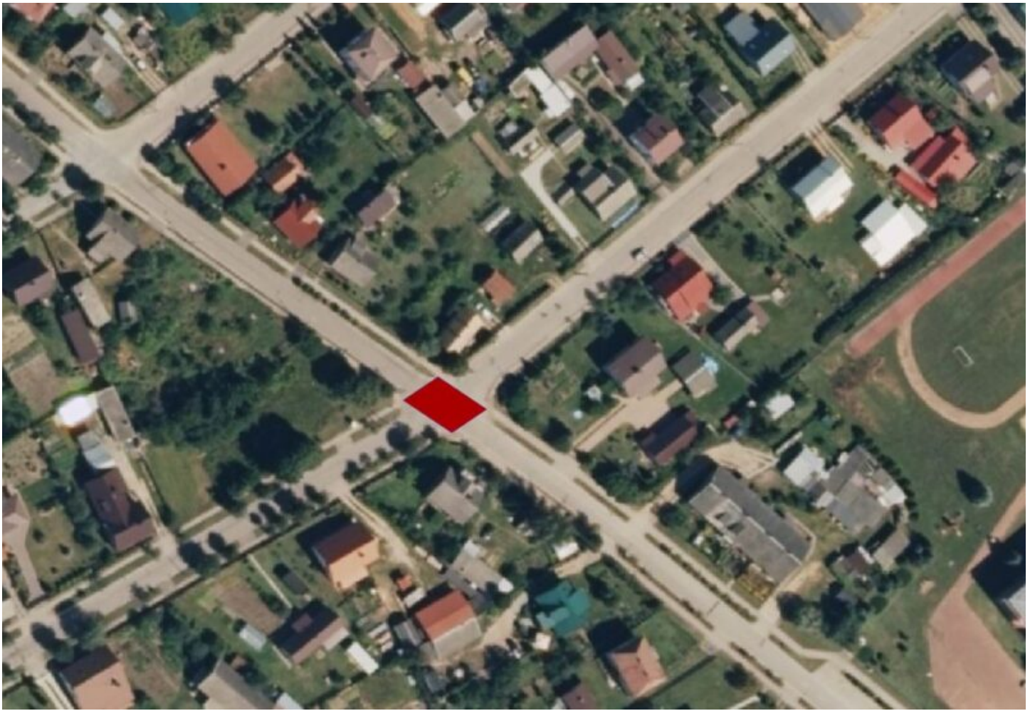
Lokalizacja 1 - skrzyżowanie ul. Młynowej i Sienkiewicza