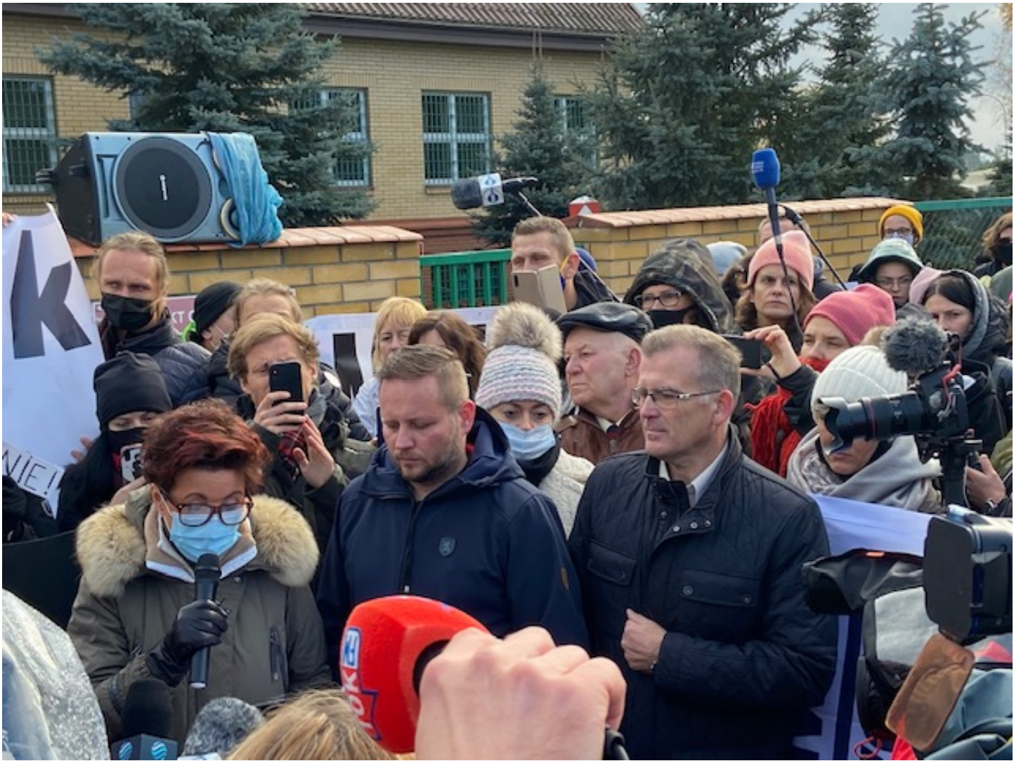
Matki na granicę. Protest pod strażnicą w Michałowie