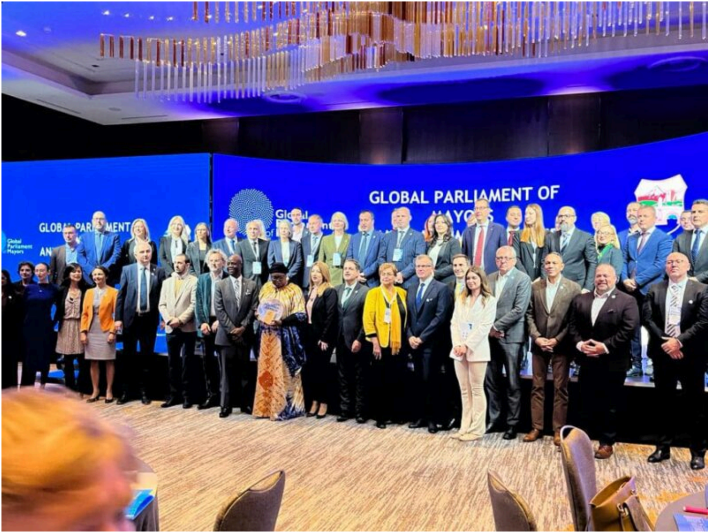
Zjazd Światowego Parlamentu Burmistrzów w Skopje