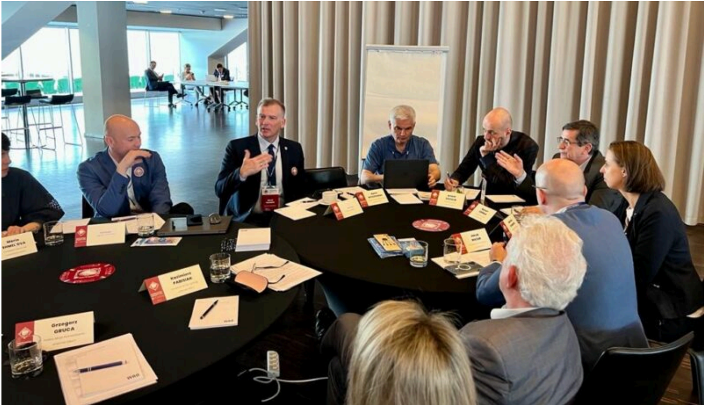
Samorządowy Okrągły Stół z udziałem burmistrza Michałowa