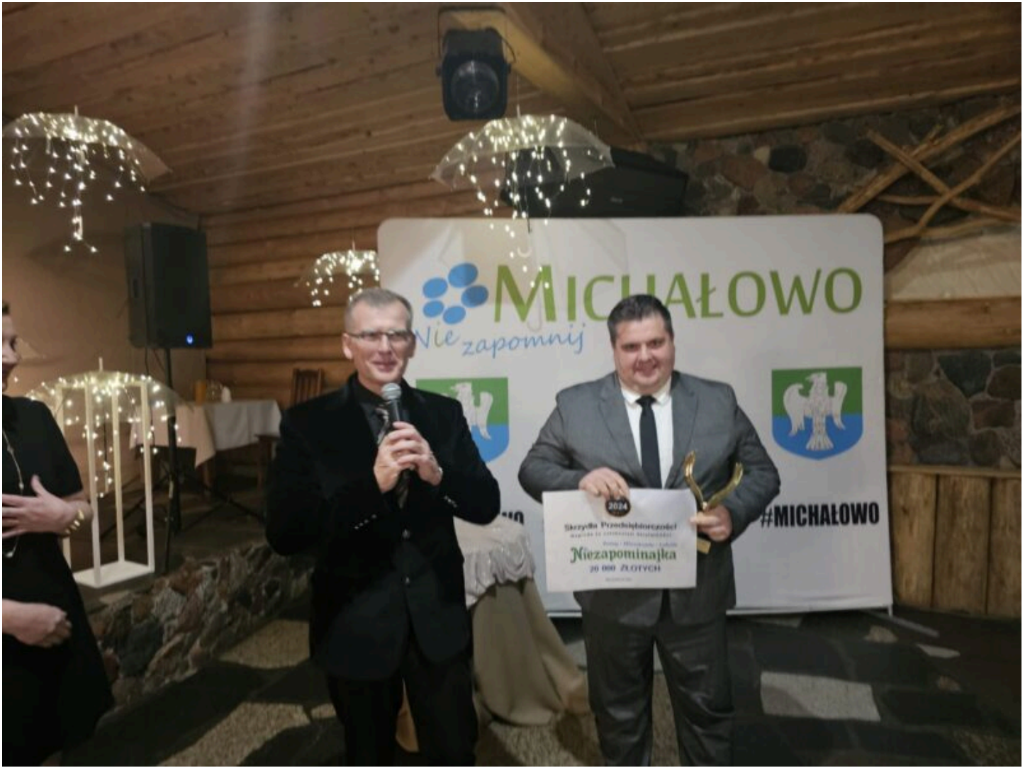
Nagroda Skrzydła Przedsiębiorczości dla Spółki "Niezapominajka"