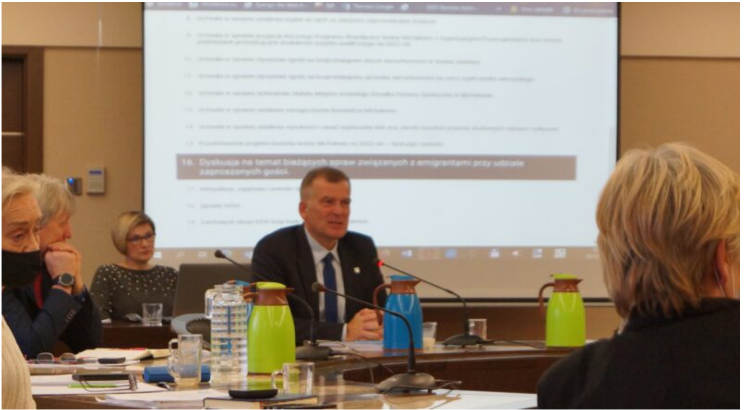
Wystąpienie Burmistrza Michałowa na temat kryzysu na granicy.