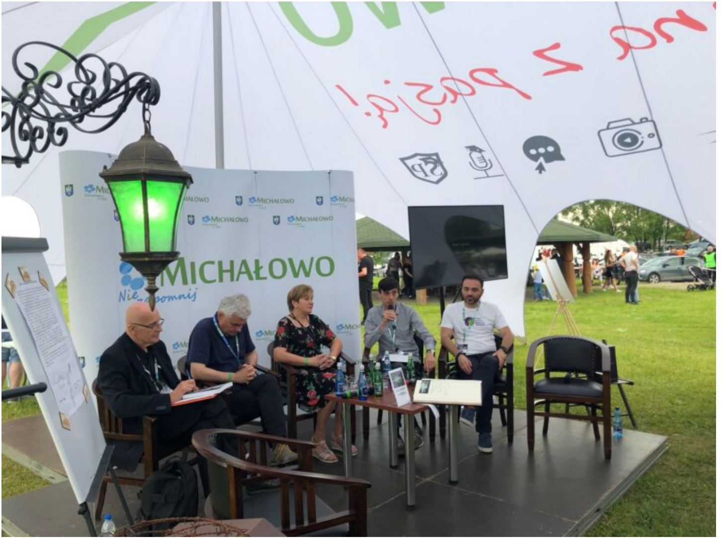
Człowieczeństwo bez Granic. Debaty w Namiocie Tolerancji podczas Dni Michałowa