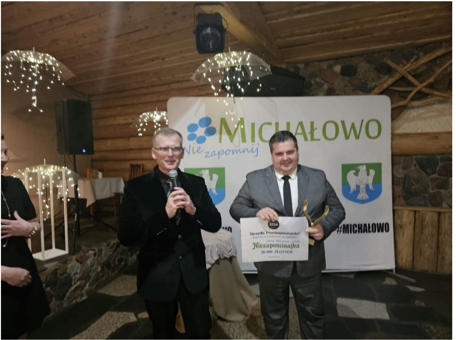
Nagroda Skrzydła Przedsiębiorczości dla Spółki "Niezapominajka"